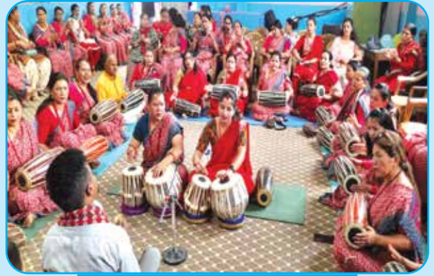
बाध्यवाधन तालिम वडा नं ३