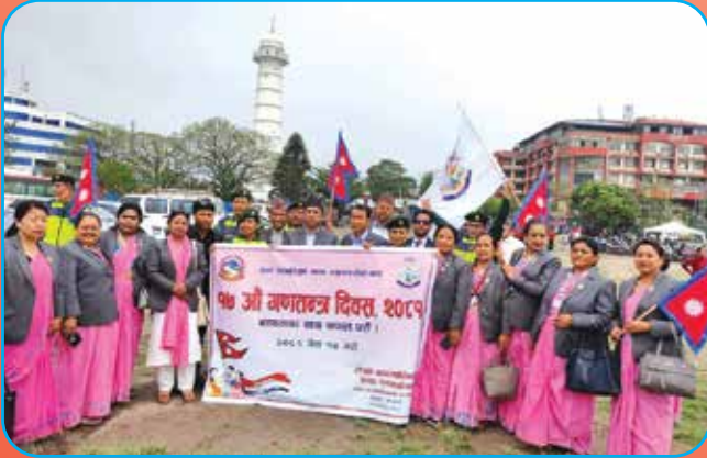
गणतन्त्र दिवसमा सहभागिता