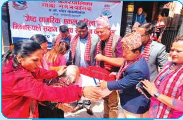
२ नं. वडामा जेष्ठ नागरिक, एकल महिला, भिन्न रूपले सक्षम मानवहरूको सम्मान कार्यक्रम