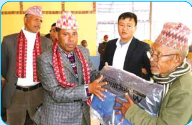
जेष्ठ नागरिक सम्मान कार्यक्रम टोखा १