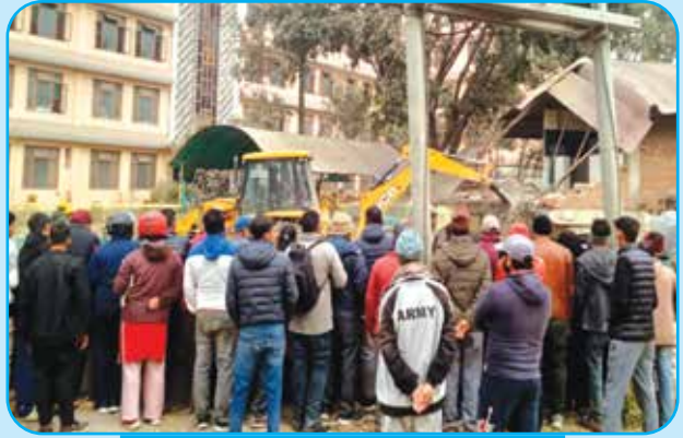
विष्णुमती करिडर मापदण्ड विपरितका घर टहरा हटाउने कार्य वडा नं ८