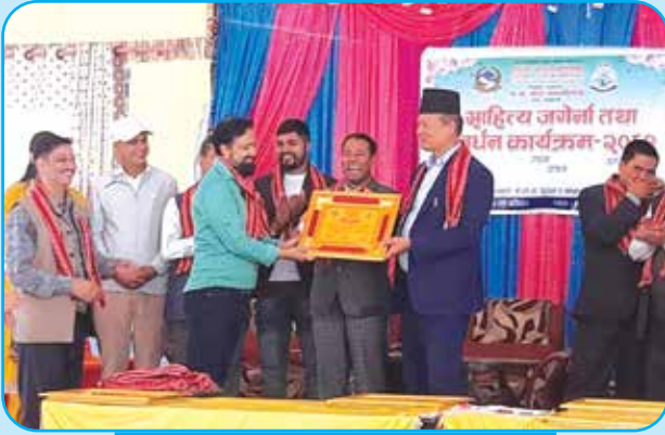
साहित्य जगेर्ना तथा प्रवर्धन कार्यक्रम वडा नं १