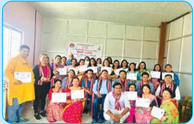
वेकरी तालिम टोखा ५