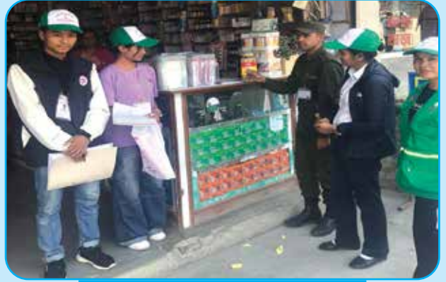
व्यवसाय दर्ता अभियान वडा नं ७