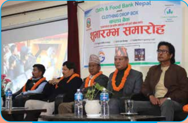
कपडा बैंक शुभारम्भ