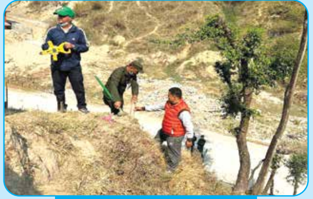
सार्वजनिक जग्गा संरक्षण र तार जाली वडा नं ६