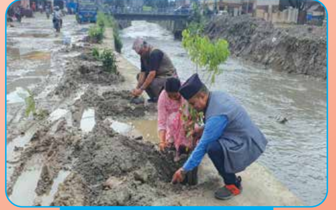
करिडेर सडकमा वृक्षारोपण गर्दै