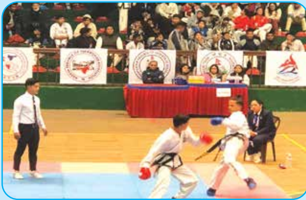
राष्ट्रिय स्तरको IAF टेक्वान्डो प्रतियोगिता र नेपाल जितकुण्डो मार्सल आर्ट मेयर कप संचालन वडा नं ४