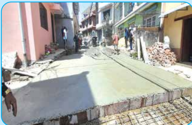
गणेशथान हात्तीगौडा जाने बाटो ढलान वडा नं ३