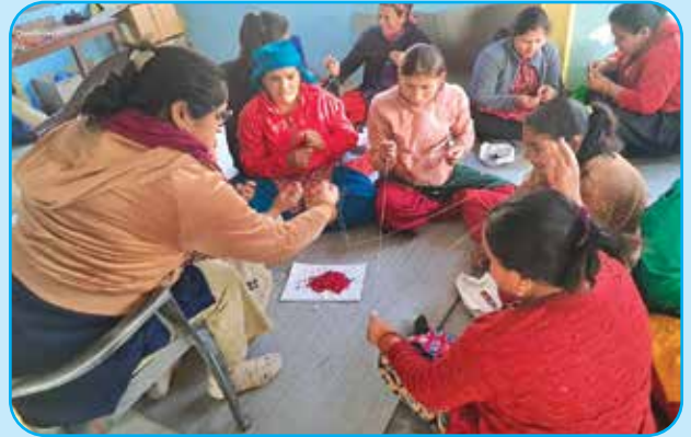
क्रिष्टलको पोते बनाउने तालिम वडा नं १