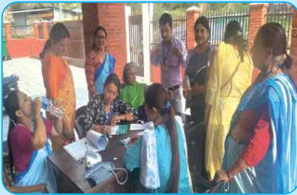
महिलाहरूको पाठेघरको मुखको क्यान्सर परिक्षण वडा नं ६