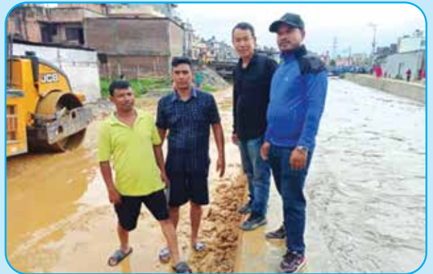
बाटो ढलान कार्य वडा नं ८