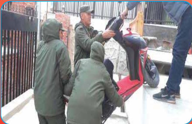
अव्यवस्थित पार्किङ्गबाट सवारी साधन