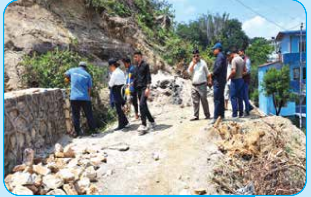
वडा नं ७ जडिवुटी पार्क