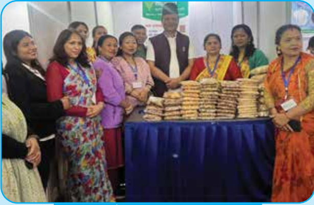
औद्योगिक व्यापार मेला