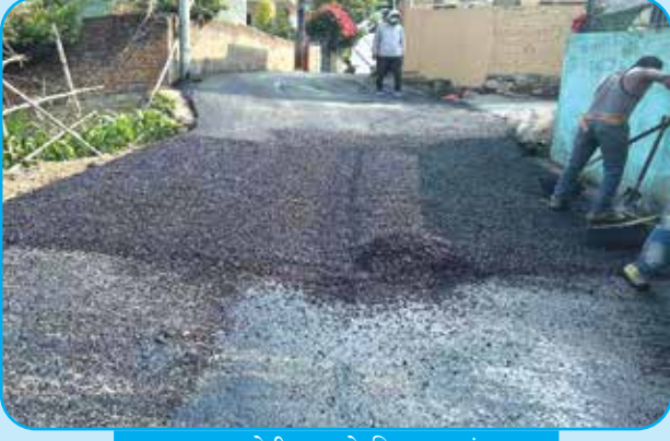
कृष्ण कलोनीमा बाटो पिच वडा नं ६