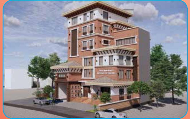
बडा नं. ८ के प्रस्तावित बहुउद्देश्यीय भवन