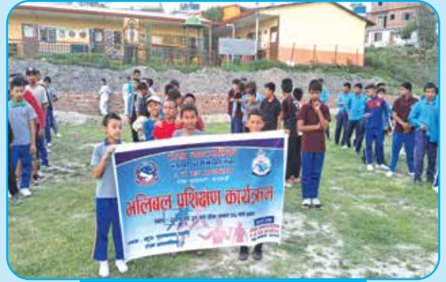
२ नं. वडामा भलिबल प्रशिक्षण कार्यक्रम