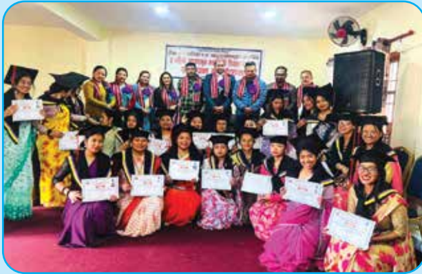
२ नं. वडामा मन्टेधरी कार्यक्रम