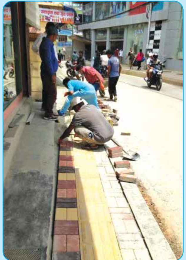
अल नेपाल हस्पिटल अगाडी मूल सडक दायाँ-बायाँ फुटपाथ निर्माण वडा नं १०