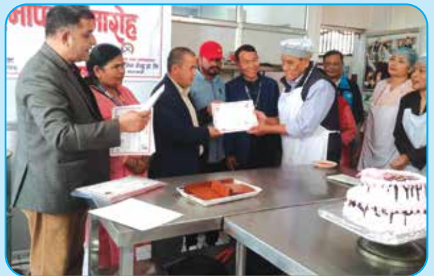
बेकरी तालिम कार्यक्रम वडा नं ८