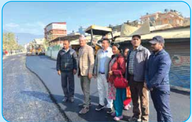
विष्णुमति करिडोर सडक कालोपत्रेको अनुगमनको क्रममा नगर प्रमुखका साथ जन प्रतिनिधि