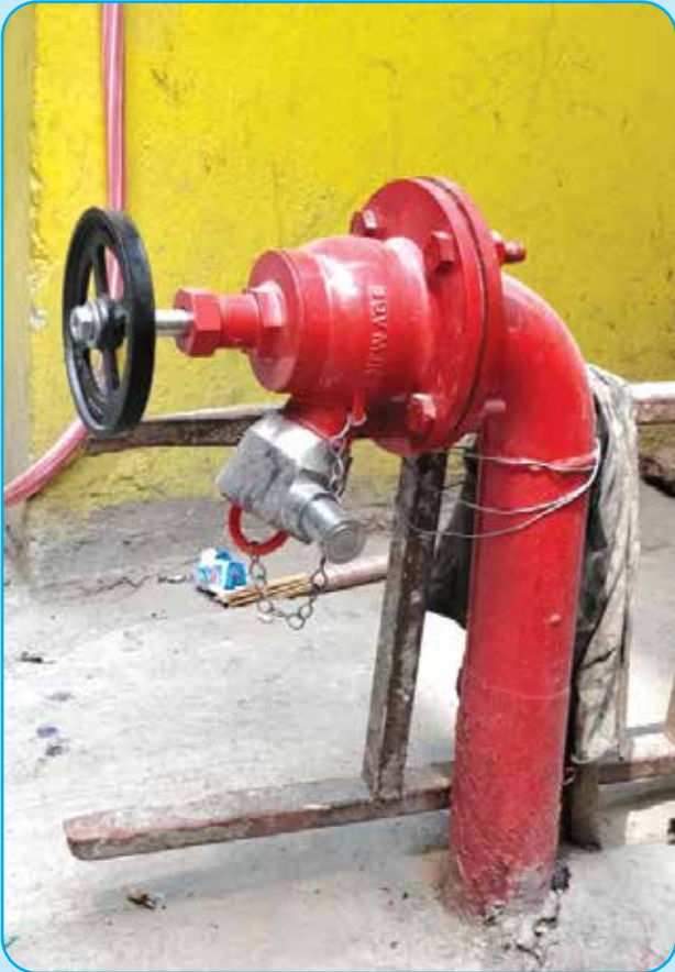
मिलन टोलमा भाल्भ तथा फिटिड सहित २२२.३० मिटर पाईप व्यवस्थापन वडा नं ९