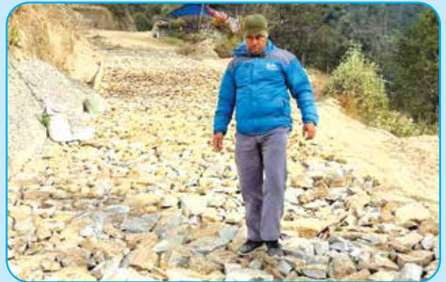
झोर गैरीगाउँ मोटर बाटो स्तरउन्नती वडा नं १