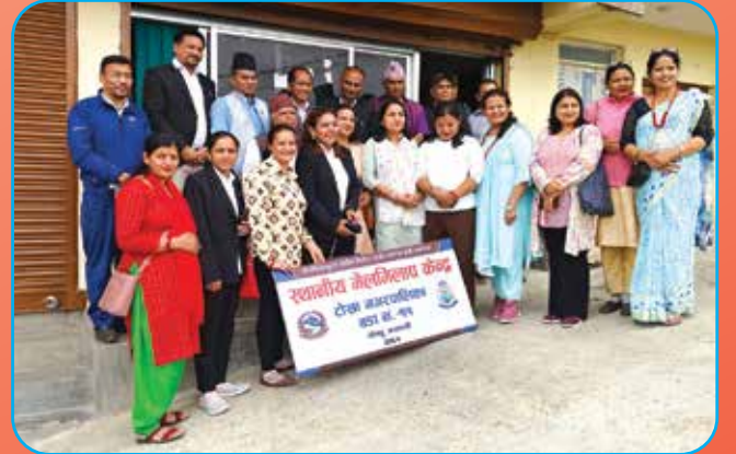
मेलमिलाप केन्द्र गठन कार्यक्रम