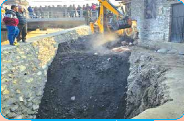
करिडेर सडक खेल्दै