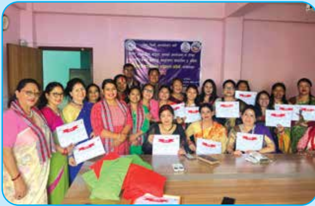
एडभान्स सिलाई तालिम टोखा ५