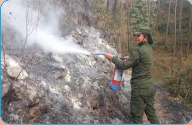
डढेले नियन्त्रणमा नगर प्रहरी