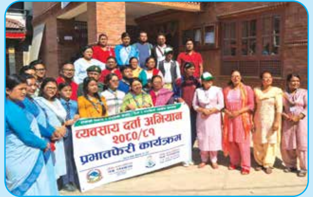
२ नं. वडामा व्यवसाय अभियान