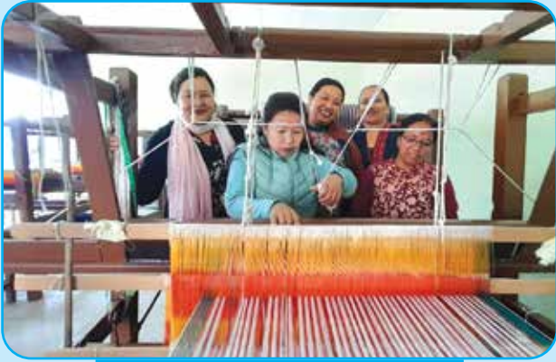
नगर स्तरीय ढाका बुनाई तालिम वडा नं ३