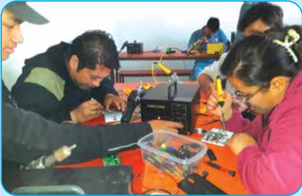
मोबाईल बनाउने तालिम वडा नं ३