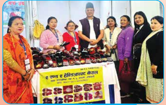
अन्तराष्ट्रिय वैदेशिक व्यापार मेला तथा घरेलु उद्योग महोत्सवमा नगरपालिकाको प्रतिनिधित्व