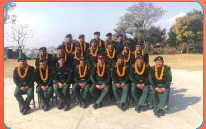
टेखा नगर प्रहरी