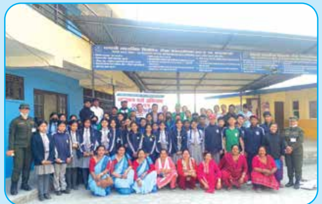
कर ससाह अभियान र व्यवसाय दर्ता अभियान संचालन