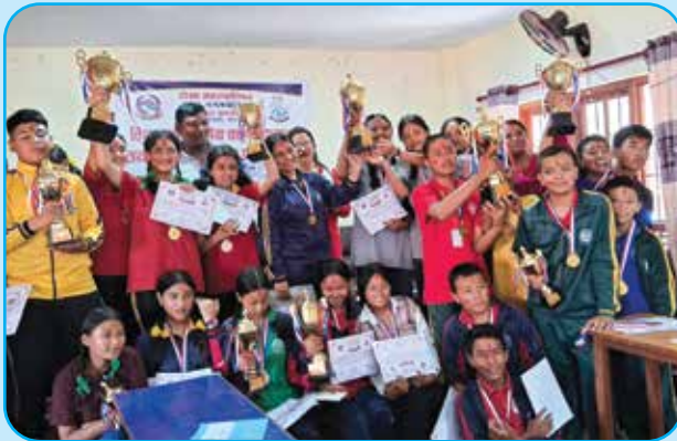
२ नं. वडामा हाजिरी जवाप र वक्तृत्वकला कार्यक्रम