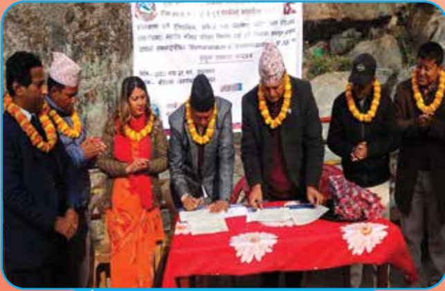
बौद्धेश्वर मन्दिर परिसर निर्माण गर्न टेखा र तारकेश्वर नगरपालिकाविच समझदारी पत्रमा हस्ताक्षर