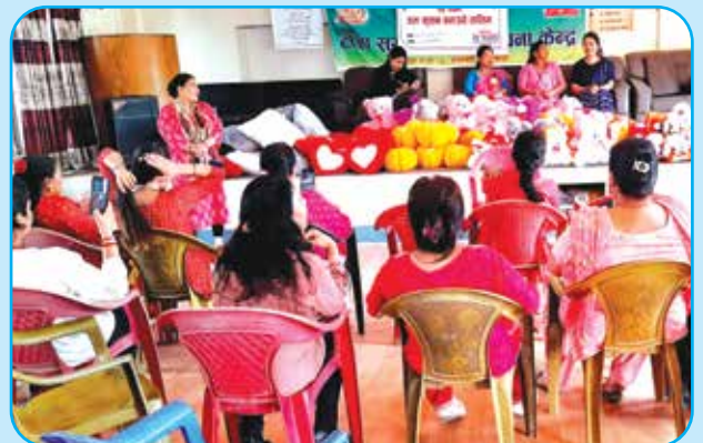
डल कुशन बनाउने तालिम वडा नं ३