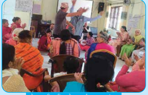
जेष्ठ नागरिक दिवा सेवा कार्यक्रम वडा नं ६