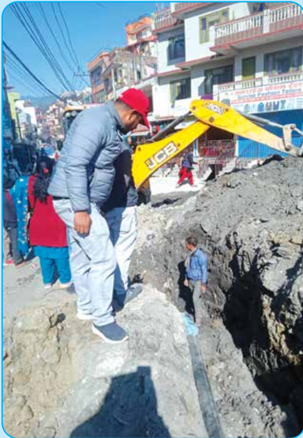
खानेपानी पाईप विच्छ्याउने कार्य टोखा ८