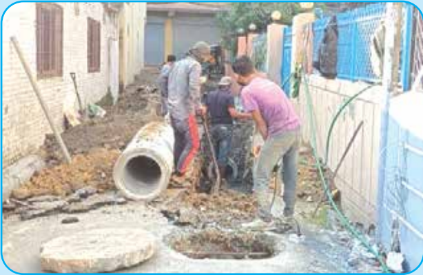
ढलको पाईप व्यवस्थापन तथा क्षमता वृद्धि वडा नं ९