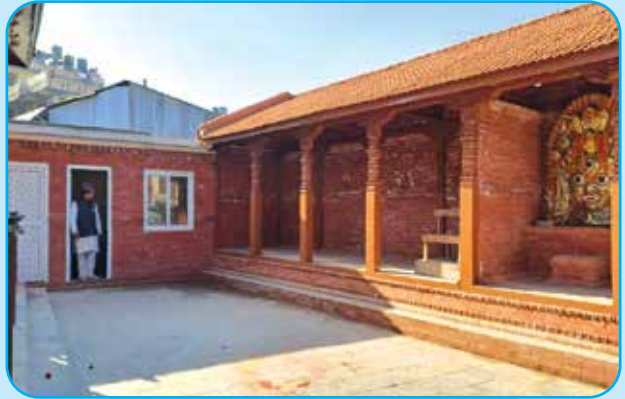
मुक्तेधर महादेव मन्दिरको परिषरमा भजन घर र पाटी निर्माण वडा नं ९