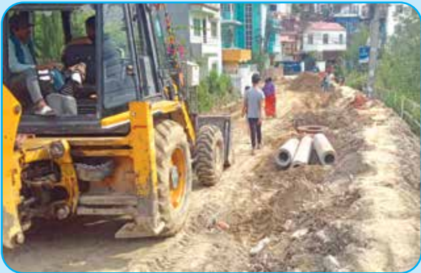
रेसुङ्गा कोलोनी देखि हेपाली जाने चोक बाटो सम्म ढल, खानेपानी पाइपलाइन विस्तार वडा नं ४