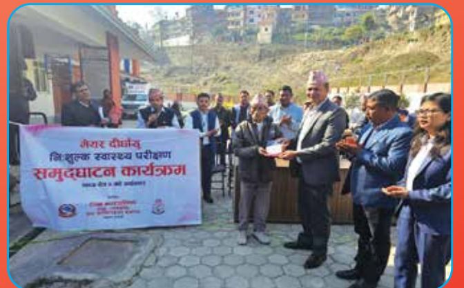
मेयर दिर्घायु कार्यक्रम शुभारम्भ