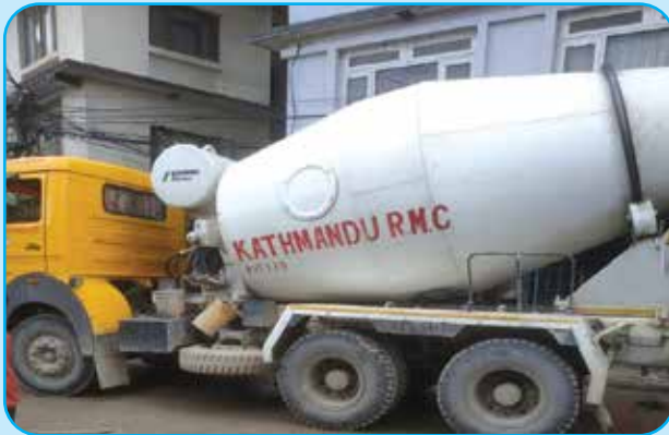
विष्णुमति करिडोर अन्तर्गत नयाँ बसपार्क पुल नजिक बजार क्षेत्रमा RMC प्रविधिमाफत सडक ढलान