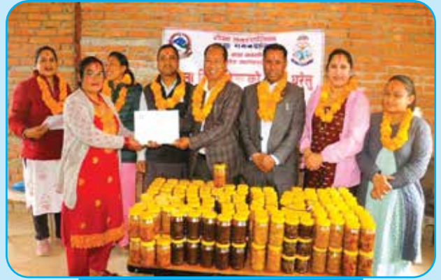
महिला विदिवहिनीहरूको लागि घरेलु अचार बनाउने तालिम वडा नं १