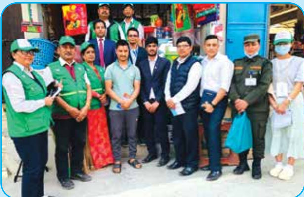
कर ससाह अभियान र व्यवसाय दर्ता अभियान संचालन