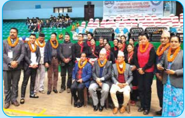
राष्ट्रिय स्तरको IAF टेक्वान्डो प्रतियोगिता र नेपाल जितकुण्डो मार्सल आर्ट मेयर कप संचालन वडा नं ४