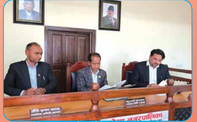
न्यायिक समिति इजलास