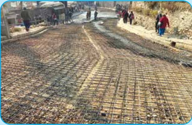
दाहालगौडा अगाडी बाटो ढलान कार्य वडा नं ७