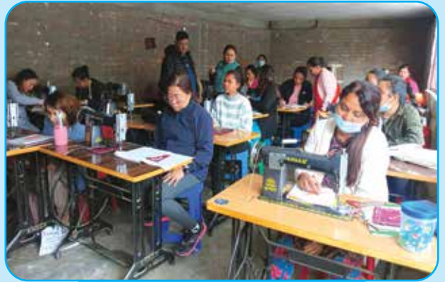
सिलाइ कटाइ तालिम वडा नं ७