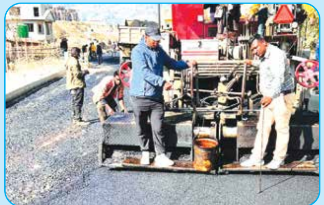
२ नं. वडाको फेडोलमा सडक पिच कार्य