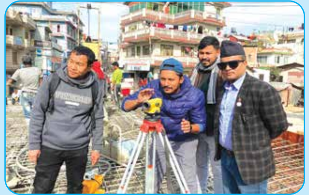
वडा नं. ११ का वडाध्यक्ष लगायत जनप्रतिनिधि बानियाँटार पुलको निरीक्षण गर्दै