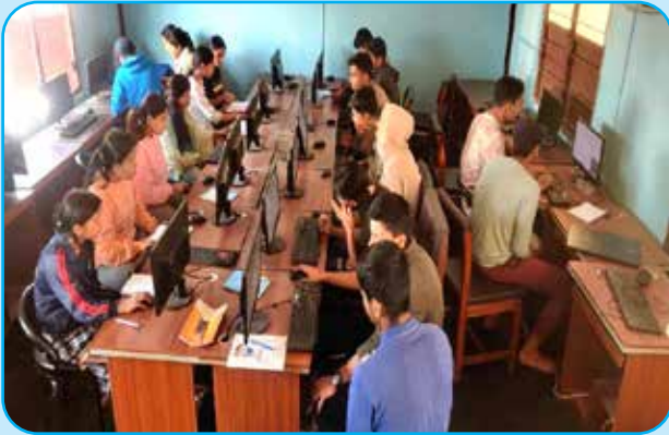
आधारभुत कम्प्युटर तालिम वडा नं १