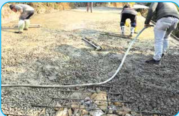
बौडेश्वर मा वि देखि भन्डारे सम्मको मोटर बाटो फराकिलो तथा बाल ड्रेन निमाण कार्य वडा नं १