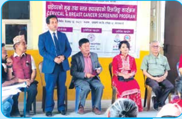
महिलाहरूको पाठेघरको मुख तथा स्तन क्यान्सरको स्क्रिनिङ कार्यक्रम वडा नं ४