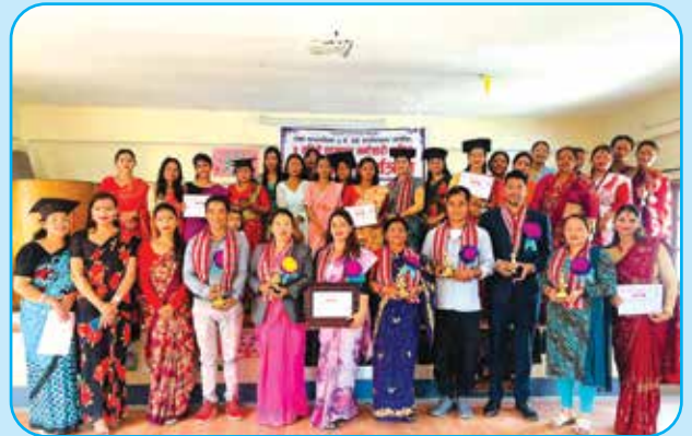
एडभान्स मन्टेधरी तालिम वडा नं ३