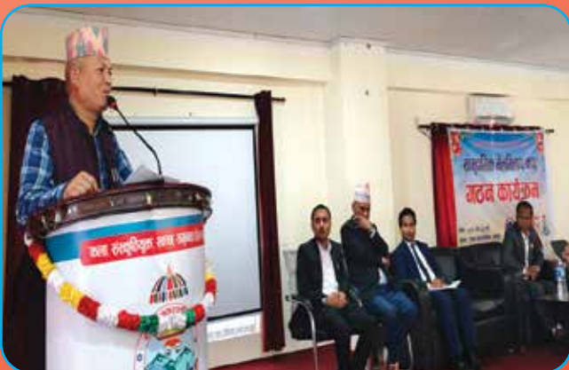
मेलमिलाप केन्द्र घोषणा कार्यक्रम