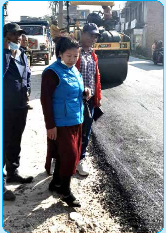
सडक कालोपत्रे वडा नं ३