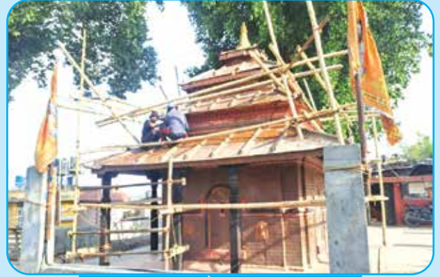
महेन्द्रेश्वर शिवालय सौन्दर्यीकरण तामा, काठको बुझा काट्ने कार्य वडा नं १०