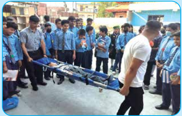
विपद व्यवस्थापन सम्बन्धी Orientation र कृत्रिम अभ्यास सहित सामग्री वितरण वडा नं ४