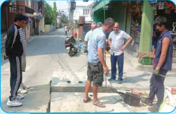
तिलिङ्टारमा मंगाल निर्माण वडा नं ७