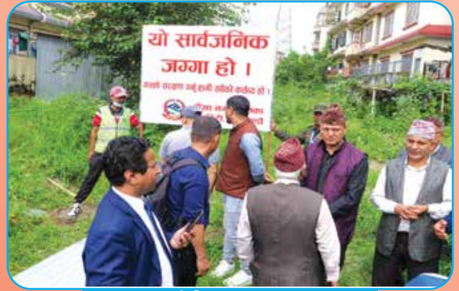
सार्वजनिक जग्गा संरक्षण