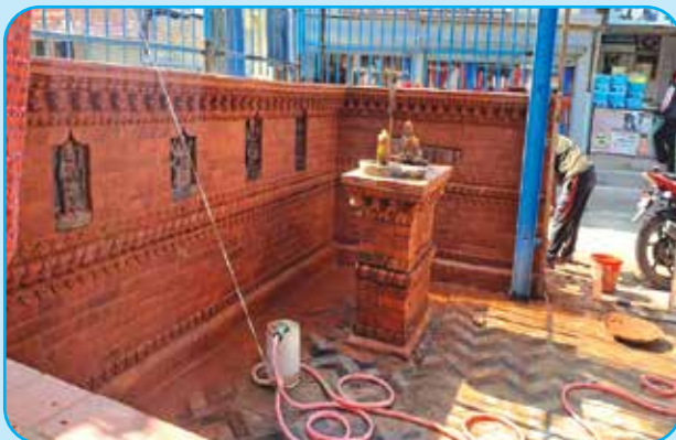
कार्य विनायक कम्पाउण्ड वालका मुर्तिहरु व्यवस्थापन वडा नं १०