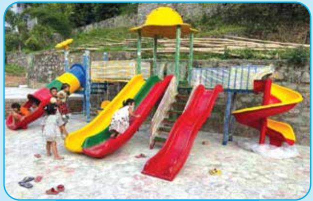
लाखेडाडामा चिड्रेन पार्क वडा नं ६